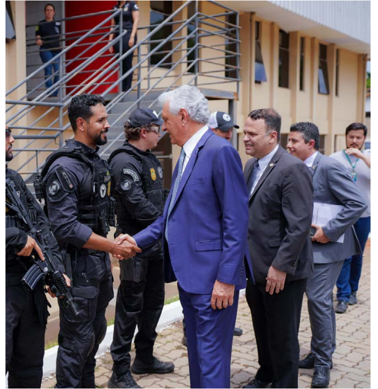
Ronaldo Caiado e gestores da Segurança durante solenidade da Polícia Civil: aprovados em concurso passam por treinamento

Delegado-geral da instituição, André Ganga disse que a Polícia Civil tem um efetivo de 3 mil profissionais. “Hoje esses concursandos que estão aqui representam mais de 30% do nosso efetivo atual. É um incremento real e efetivo nas nossas trincheiras da PC”, afirmou.