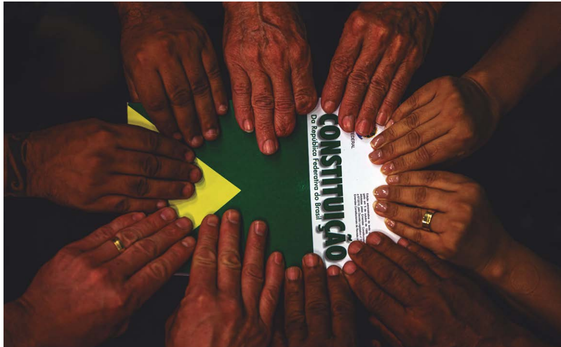
A Constituição recebeu 72.719 sugestões de cidadãos e 12 mil de constituintes e entidades representativas

Ao erguer um exemplar da Constituição, o presidente da Assembleia Nacional Consti-