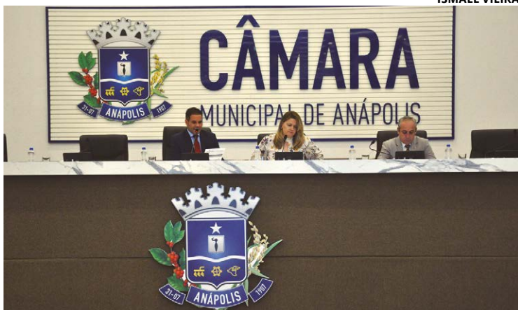
Mesa da Câmara cancelou trabalhos 10 minutos após início da sessão