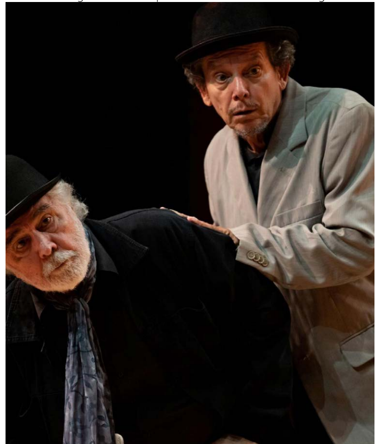
Estreia hoje: cena de 'Ensaio Esperando Godot'