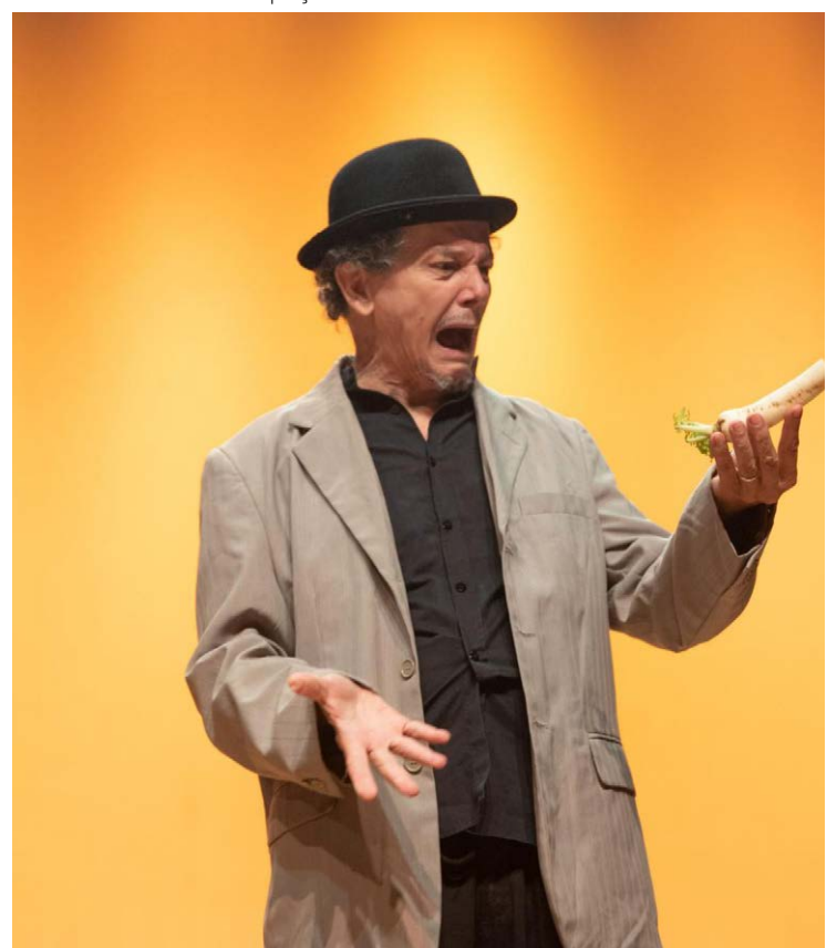
Meio goianiense: companhia é referência no dramaturgo