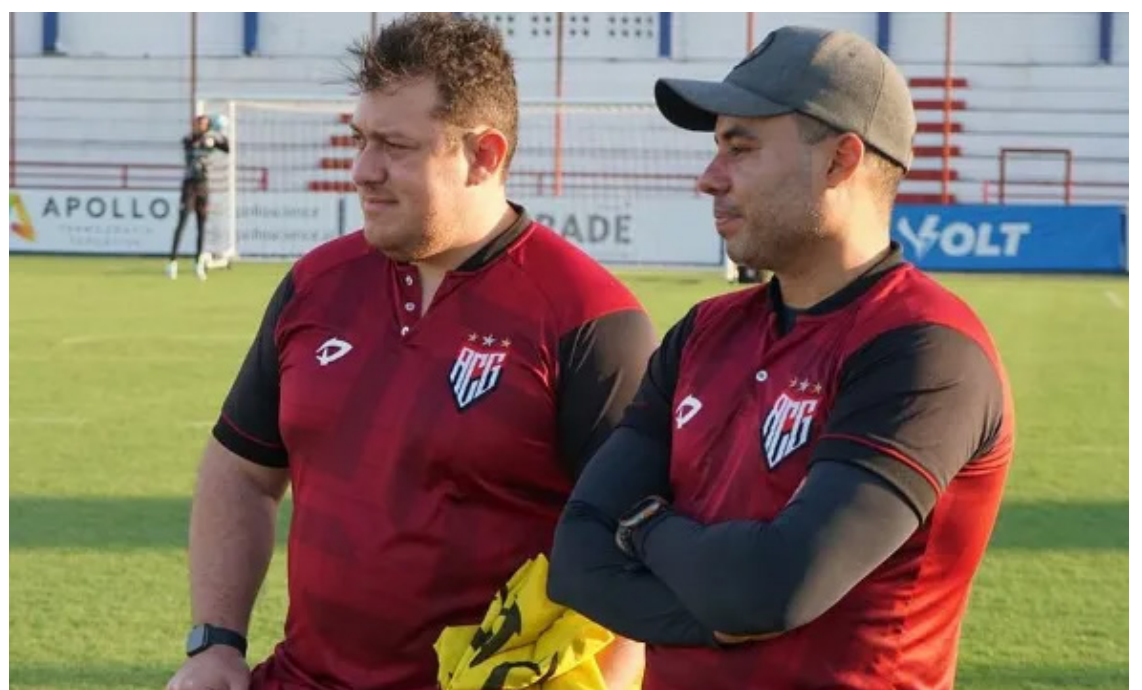
Atlético-GO entra em campo na sexta-feira, 6, no Estádio Antônio Accioly, onde vai enfrentar o Ituano

O Atlético-GO entra em campo na próxima sexta-feira, 6, no Estádio Antônio Accioly, onde vai enfrentar o Ituano. Uma vitória nesse confronto pode colocar o clube dentro do G4, desde que Juventude, Guarani e Novorizontino percam na rodada.