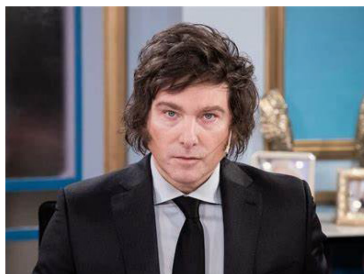
Palácio do Planalto: sem intenção de prejudicar Javier Milei

O contato do Palácio do Planalto com Tebet ocorreu no fim de agosto, às vésperas da visita do ministro da Economia, Sergio Massa, nome apoiado pelo presidente Alberto Fernández para a sua sucessão. Partiu do gabinete do ex-chanceler Celso Amorim. Ele despacha no terceiro andar do Planalto, perto do gabinete do presidente, e atua hoje como assessor especial de Lula para a área internacional.