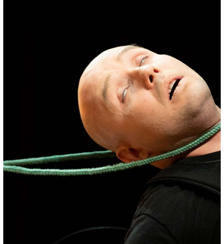
Clássico: peça de Beckett revolucionou teatro