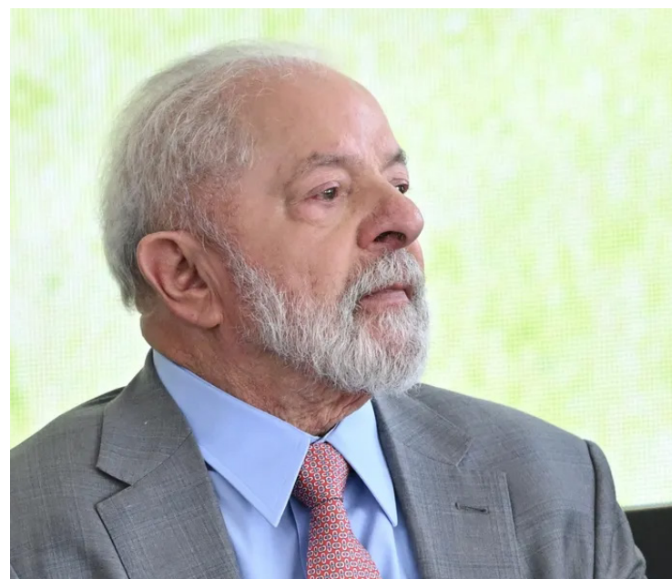
Lula da Silva: melhora desempenho do governo junto à população

Realizada entre os dias 27 de setembro e 1º de outubro, a pesquisa CNT/MDA entrevistou 2.002 pessoas em todo Brasil. A margem de erro é de 2,2 pontos percentuais, com intervalo de confiança de 95%.