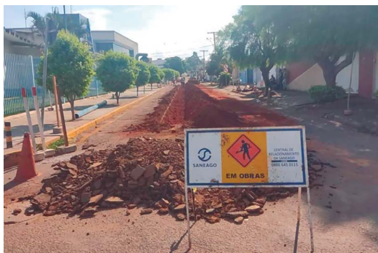
Atividades das equipes da Saneago acontecem diariamente, das 8h às 18h

No dia 9, segunda-feira, o serviço será realizado na Rua Tonico de Pina e Rua Benjamin Constant, Setor Central. Com isso, o abastecimento poderá ser