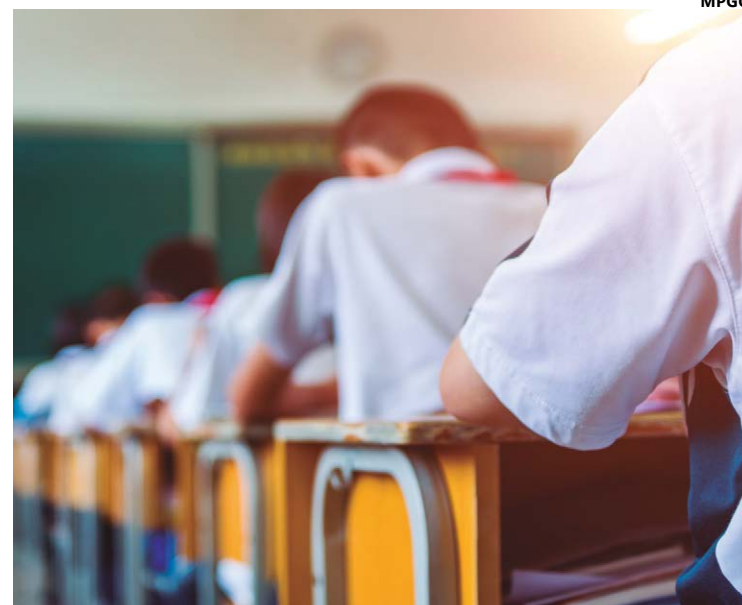
Alteração deve ser feita de imediato, de modo que alcance ainda este ano letivo que está em curso, sem prejuízo para os próximos anos

Apesar da listagem apresentar a cidade de Valparaíso acima de Anápolis, ela não possui um histórico na pesquisa, por ser a primeira vez em que foi introduzida nesse ranking.